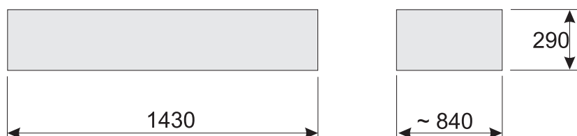
Platformy sklejkowe - antypoślizgowe